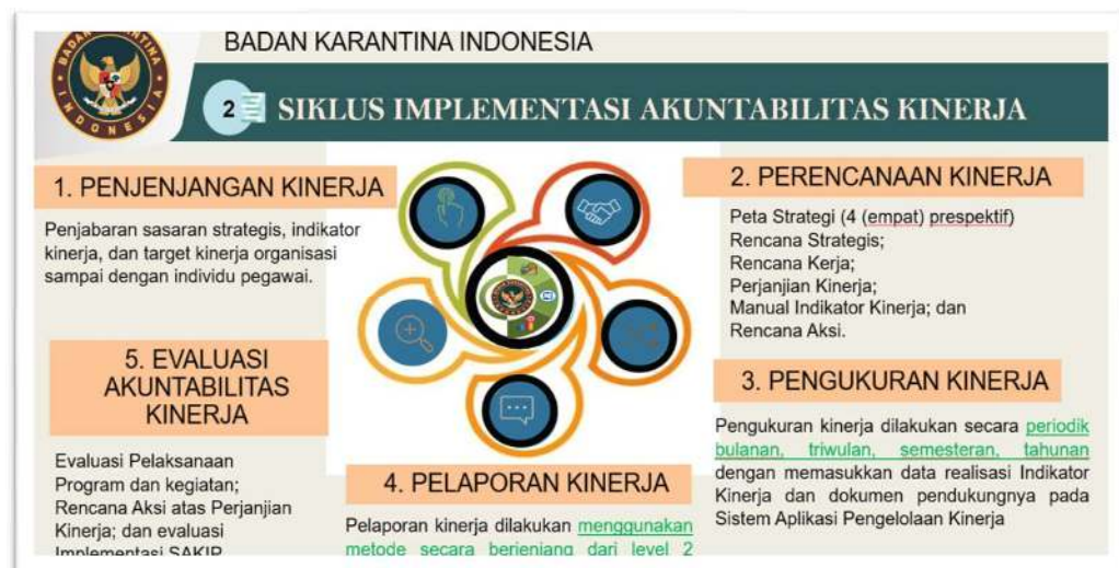
Gambar.1 Siklus Implementasi Akuntabilitas Kinerja

Model logika informasi kinerja yang digunakan adalah kegiatan-kegiatan yang dilakukan harus mendukung indikator kinerja yang telah ditetapkan dalam Rencana Strategis dalam rangka menjalankan logika informasi kinerja tersebut siklus monitoring dan evaluasi yang digunakan.